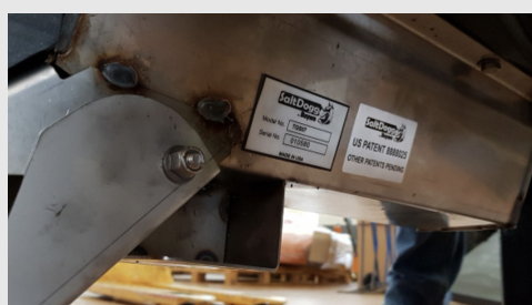
Fond de cuve en inox