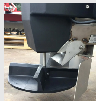
Disque d'épandage synthétique Déflecteur arrière inox