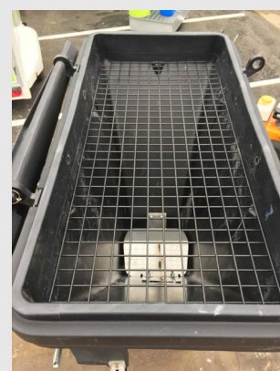
Grille de protection