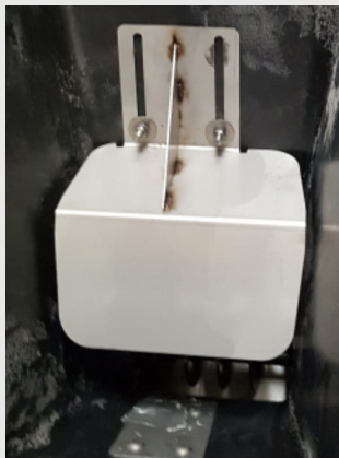
Limiteur de produit sur la vis